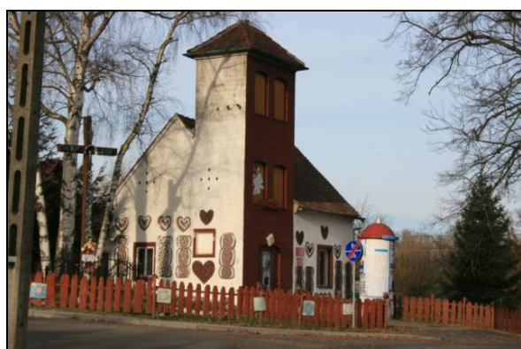
Fot. 3. Piernikowa chata – specjalizacja wsi zauważalna w dekoracji budynków. Photo 3. Gingerbread cottage – specialization of the village visible in a decoration of buildings.