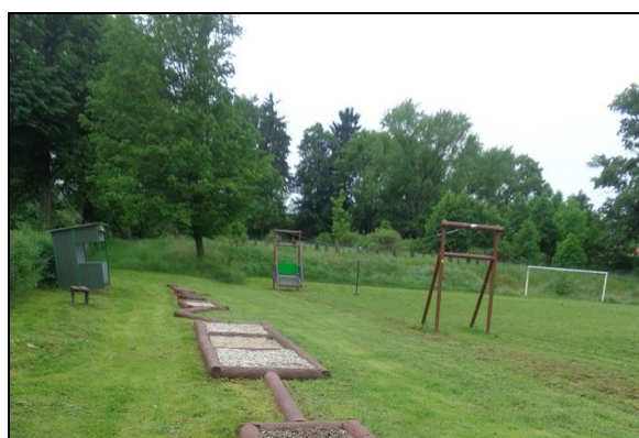
Fot. 2. Miejsce spotkań służące rekreacji i wypoczynkowi. Photo 2. Meeting place for recreation and relaxation.