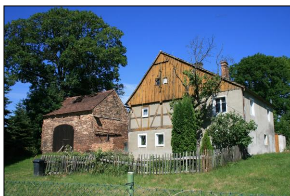
Fot. 4. Tradycyjna zabudowa Spytkowa. Photo 4. Traditional buildings in Spytków.