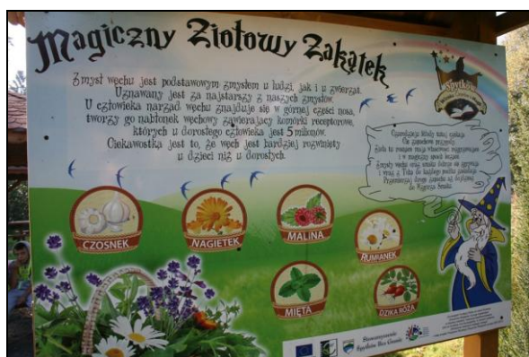
Fot. 1. System informacji wizualnej. Photo 1. Visual information system.

wzmocnia jest centrum wybudowane w ramach projektu przygotowanego i pilotowanego przez Urząd Gminy Zgorzelec. Ponadto różne formy przestrzenne nawiązujące do tematyki wsi, poza samym centrum, zauważalne są także w innych fragmentach wsi oraz okolicy. W ofercie wsi tematycznej są zajęcia artystyczne wykorzystujące „dary natury”, możliwość wypieku chleba w tradycyjnym piecu chlebowym, gry i zabawy oparte na zasobach przyrodniczych i tradycji wsi oraz trasy spacerowe i przejażdżki „czarobusem” ukazujące walory krajobrazowe otoczenia. Ten przykład wskazuje na dużą świadomość mieszkańców, których oferty pomagają w ochronie piękna tradycyjnego krajobrazu ich miejscowości. Do wioski tematycznej już przy wjeździe zaprasza stylowy witacz, a jednolicie opracowany system informacji wizualnej, oparty na spójnej i wyraźnej grafice kojarzącej się z tematem wiodącym wsi wprowadzonej zarówno do tablic informacyjnych jak i grafiki strony internetowej pozytywnie wpływa na odbiór wizualny i zachęca do głębszego poznania oferty (fot. 1).